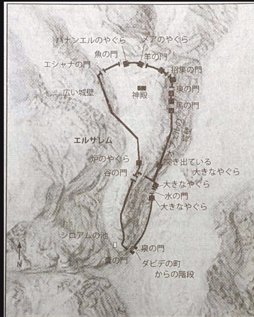
エルサレムの城壁と12の門 The wall and gates of Jerusalem