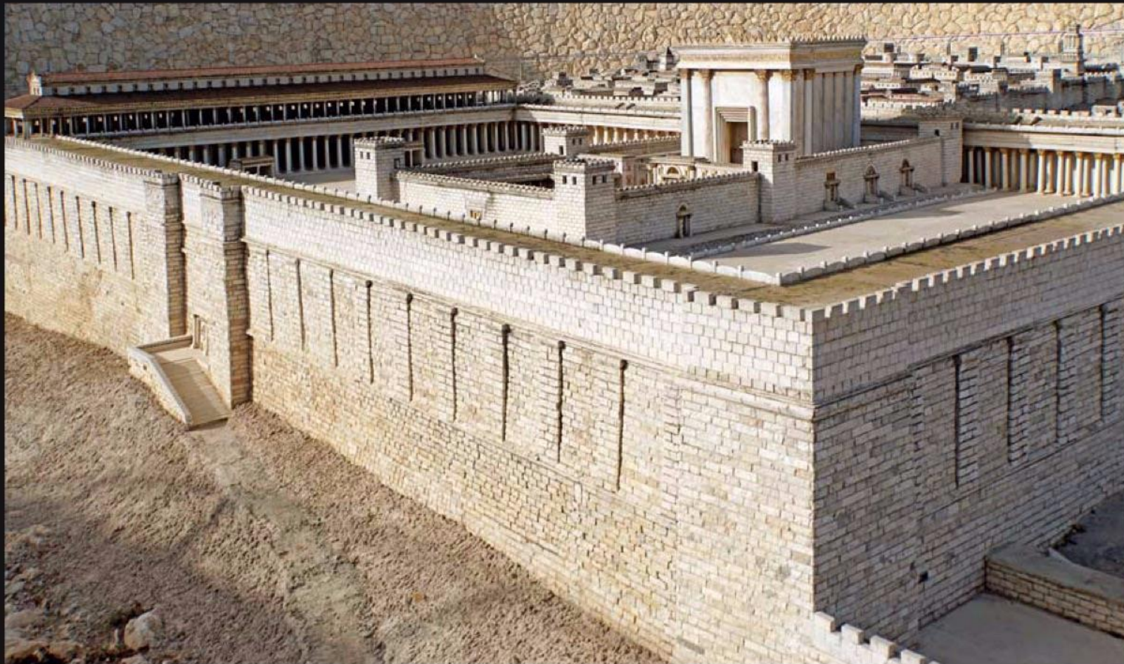
ヘロデ王の城壁 (BC 30~) The King Herod's Temple