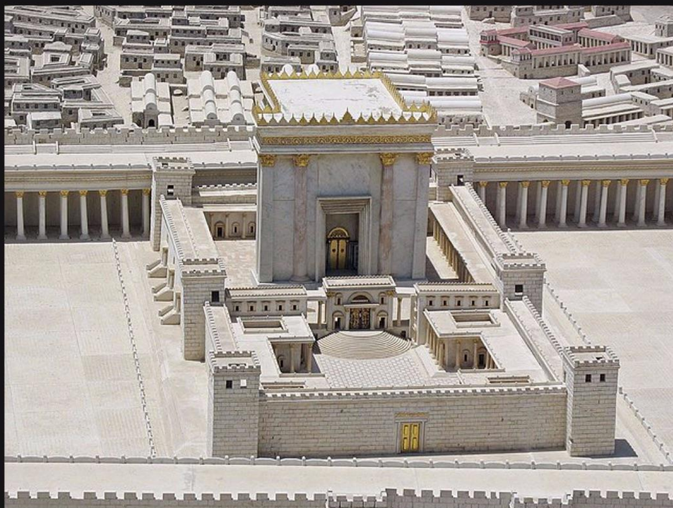
ヘロデ王の神殿 (BC 30~) The King Herod's Temple