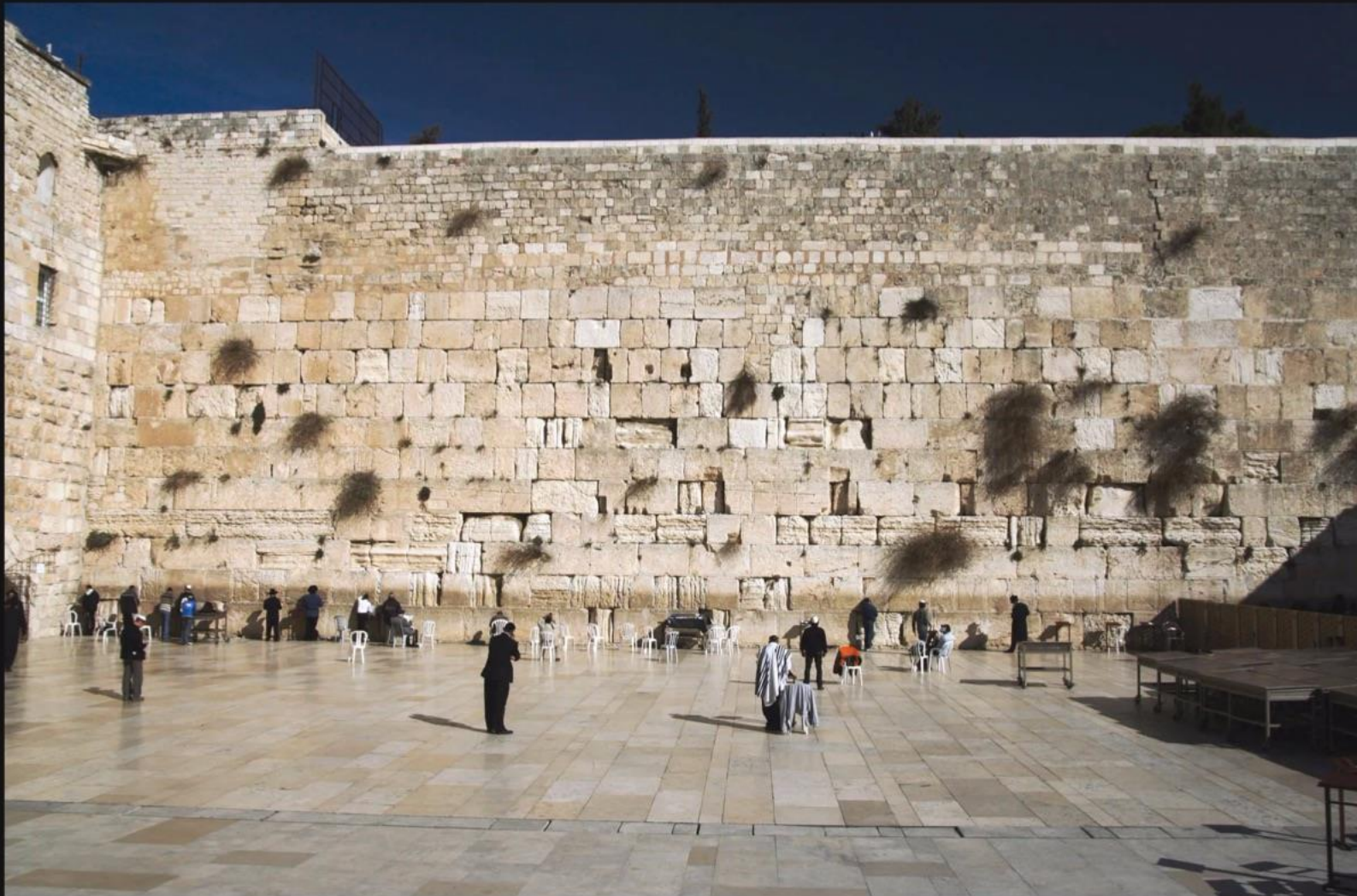
嘆きの城壁 The Wailing Wall